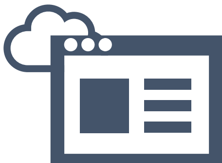
Soliton OneGate 利用申請書作成支援ツール

Soliton OneGate利用申請書作成支援ツールを使用して、Soliton OneGateのお申込内容をご記入ください。