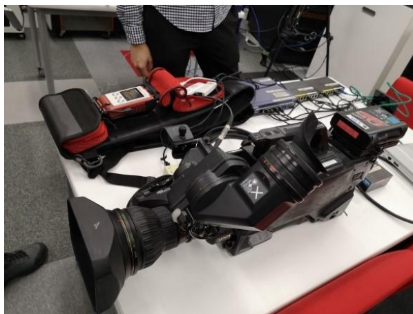
写真 2: 放送用ハイビジョンカメラに接続されたZao-S