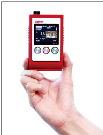
写真 1: Zao-S