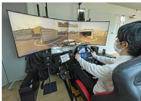
図 3: 遠隔センター(遠隔運転操縦装置)

※ トーイングトラクター: 空港制限区域内において、空港貨物や乗客の手荷物の運送用コンテナを牽引する車両