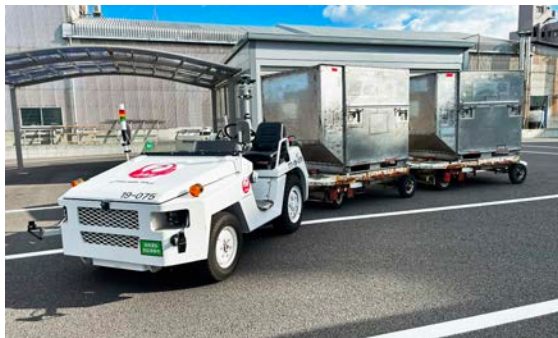
図 2: 遠隔運転トーイングトラクター(貨物コンテナ牽引)