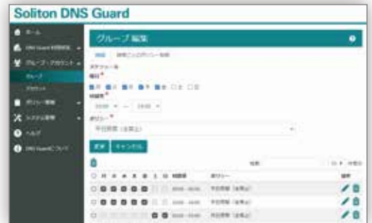
設定例：時間ごとのポリシー制御