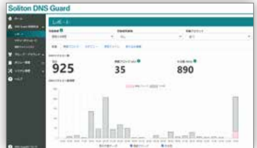
レポート：DNS Guard 利用状況

場所を問わずインターネットリスクから保護できるエージェント型。NetAttest D3 で DNS Guard オプションを利用すると校内・組織内はエージェントレスで保護できます。