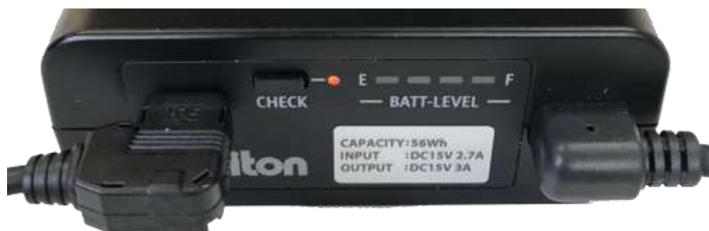
図 3 充電状態