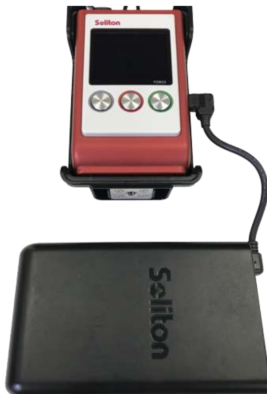
図 2 Zao-S への接続