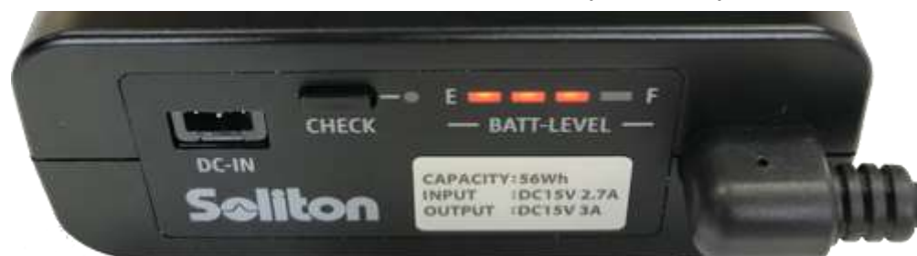
図 4 残容量表示

バッテリーの残容量に応じて、バッテリー残量表示ランプ(オレンジ色)が点灯します。