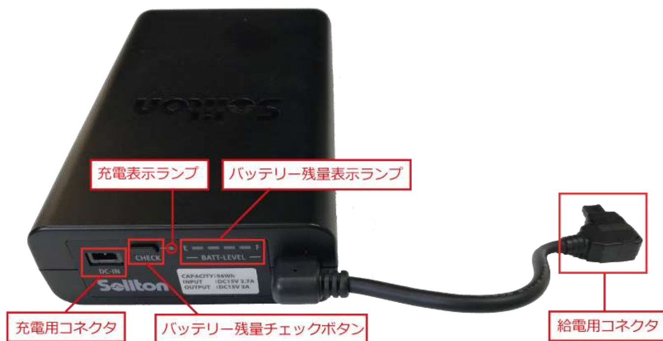
図 1 各部の名称